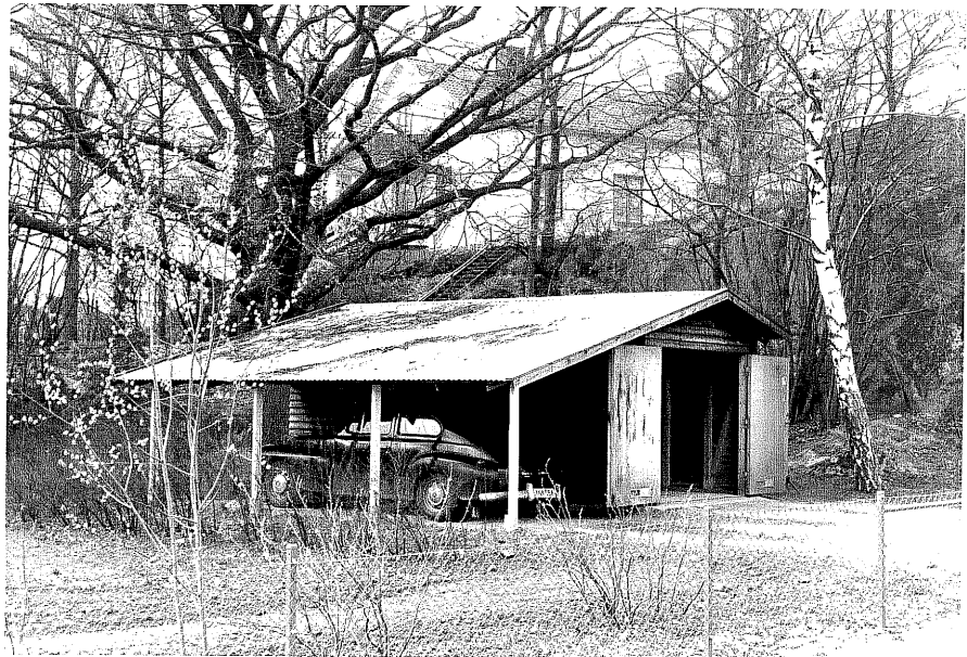
Garage fr.SO, 9:3.