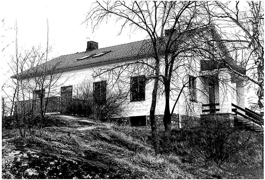
Bostadshus fr.SV, 9:2.

Ödeshög sn Kronhjorten 1 Södra vägen foto:M.Wikdahl,1978.