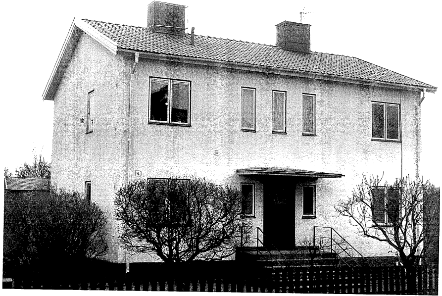
Bostadshus fr.N, 9:7.

Ödeshög sn Kronhjorten 6 Klockarevägen 4 foto:M.Wikdahl,1978.