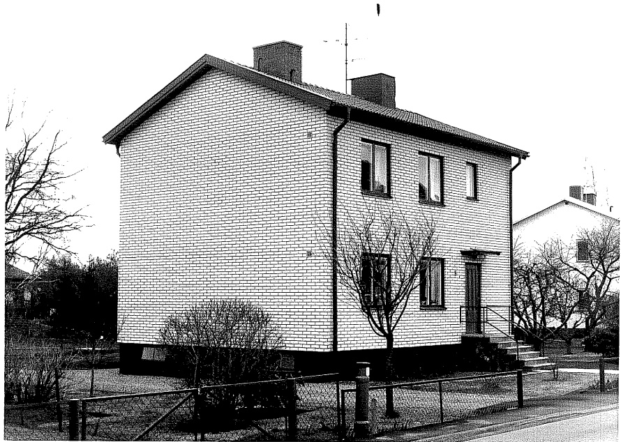
Bostadshus fr.N, 9:8.

Ödeshög sn Kronhjorten 7 Klockarevägen 6 foto:M.Wikdahl,1978.