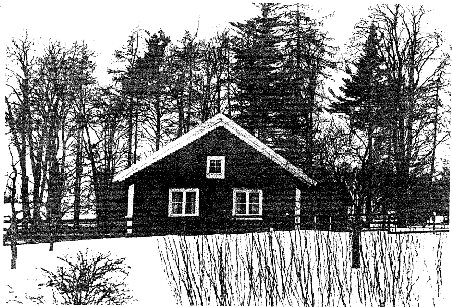
Neg.nr. 01:04:09 Hembygdsgård från O. (nr 1 sit. plan)

Heda s:n Heda 1:1 F d Komministerbostad Hembygdsgård