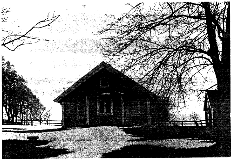
Neg.nr. 01:04:13 Hembygdsgård från V. (nr 1 sit. plan)